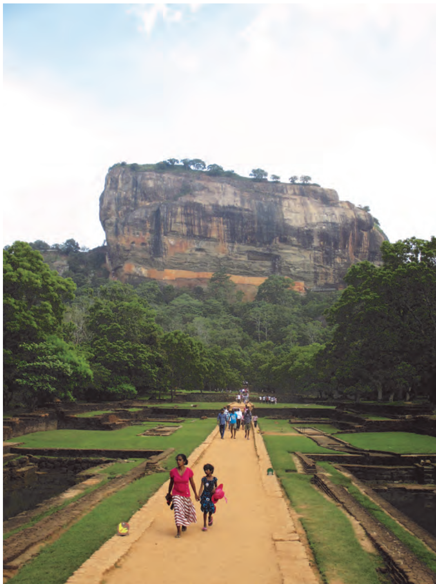
The Lion Rock of Leeuwenrots ligt in het centrale hart van Sri Lanka. De toegangspoort wordt gevormd door gigantische leeuwenklauwen. Deze unieke rots is een van de mooiste bezienswaardigheden en tevens een van de zeven Werelderfgoed-locaties die het land rijk is. In spirituele kringen wordt gesproken over een bijzondere krachtplek, met een verbinding of lichtbrug naar Uluru of Ayers Rock te Australië, Madagascar en Zuid-Afrika.

eigenste ogenblik iets van werkelijk kosmische aard en wij met z'n allen staan voor de grootste ontdekkingsstocht van ons leven! De komende decennia zal onze maatschappij zodanig veranderen, dat we versteld zullen staan. Wat ieder van ons ook zal beslissen: het zal gewicht in de schaal leggen en zo mede de uitkomst bepalen. Ja, zo groot is de verantwoordelijkheid van ons allen!